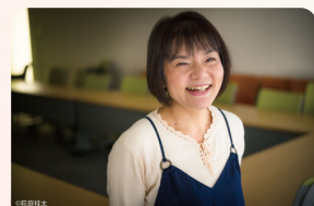
映画監督 信友直子氏

1961年広島県呉市生まれ。父・良則、母・文子のもとで育つ。1986年テレビ番組制作の道へ。2010年独立してフリーディレクターに。主にフジテレビでドキュメンタリー番組を多く手掛け社会的なテーマや文化的なテーマなど100本近くの番組を制作。2018年に『ぼけますから、よろしくお願ひします。』で長編監督デビュー。